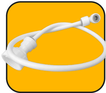
Manguera corta 54 cm de 1/4" con codo y conector hembra de 3/4"