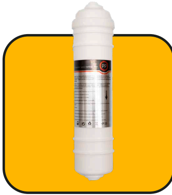
Filtro de polipropileno