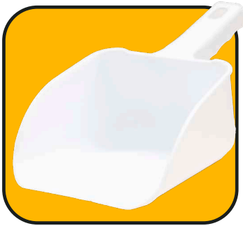
Pala de plástico