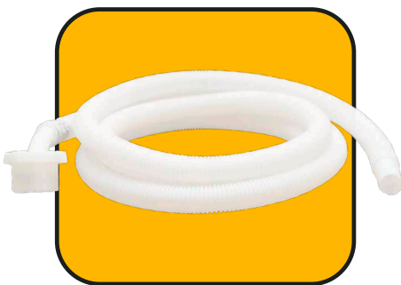
Manguera de desagüe 2 m de 1/2" con conector 3/4"