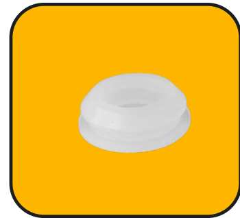
Tapón de depósito de agua