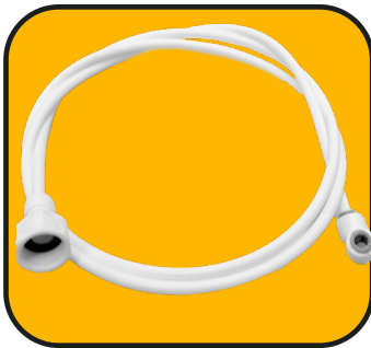
Manguera larga 152 cm de 1/4" con codo y conector hembra de 1/2"